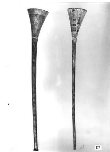
truba iz Egipta